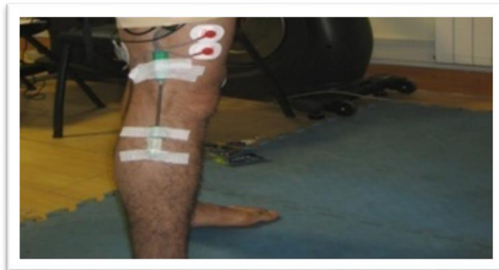
شکل ۲. قرارگیری الکتروگونیا متر

الکتروگونیا متر نیز در بخش خارجی مفصل زانو و روی اپیکندیل خارجی مفصل مطابق شکل ۲ قرار داده شد.