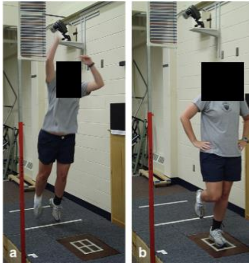
شکل ۱. نحوه انجام پروتکل پرش-فرود روی دستگاه توزیع فشار کف پا

می‌کرد. آزمودنی‌ها چندین مرتبه آزمون را به منظور آشنایی انجام می‌دادند و در آخر، سه مرتبه، آزمون تکرار و داده‌ها ثبت می‌شد (۱۶) (شکل ۱).