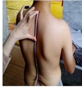
شکل ۲. نحوه اندازه‌گیری و محاسبه زاویه قوس پشتی بوسیله خط کش منعطف

برای اندازه‌گیری زاویه کرانیوورترال (CV) از گونیامتر مخصوص HPSCL ساخت ایران استفاده شد. جهت ارزیابی، زائده خاری CV تعیین و علامت‌گذاری شد. سپس در حالی که کودک در یک وضعیت طبیعی روبه رو را نگاه می‌کرد، در نمای جانبی، محقق، محور گونیامتر را موازی با زائده خاری مهره CV و بازوی متحرک آن را روی تراگوس گوش (غضروف بخش قدامی) تنظیم کرد. زاویه میان بازوی متحرک و خط افقی که از مهره CV عبور می‌کند، زاویه کرانیوورترال است (۲۱). میانگین سه مرتبه اندازه‌گیری، برای تحلیل نهایی به کار رفت. دامنه حرکتی اکستنشن و فلکشن زانو و ران و ابداکشن ران با گونیامتر یونیورسال ۳۶۰ درجه اندازه‌گیری شد که در تحقیقات گذشته رویایی بالا و پایایی خوب تا عالی برای آن گزارش کردند (۲۴، ۲۵) و با استناد به توصیه‌های آکادمی جراحان ارتوپدی آمریکا (۱۱)، در هریک از شرکت‌کنندگان در سه آزمایش، اندازه‌گیری شد و میانگین آنها برای تحلیل نهایی به کار رفت. لازم به ذکر است با قرار دادن دست روی ران و لگن طرف مقابل مانع از هرگونه حرکت جبرانی و ایجاد خطا در اندازه‌گیری گشت.