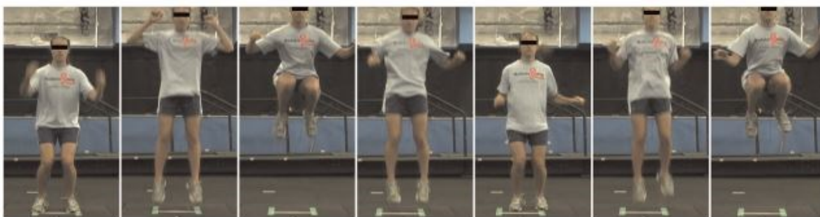
شکل ۱. نحوه اجرای آزمون پرش تاک

آزمون پرش تاک: اجرای آزمون پرش تاک برای تعیین نقص کنترل تنه به این صورت بود که هر یک از آزمودنی‌ها با پاهای باز به اندازه عرض شانه ایستاده و به صورت عمودی شروع به پرش می‌کرد و زانوهای خود را تا جایی که امکان داشت بالا می‌آورد تا در بالاترین نقطه پرش، ران‌ها موازی با زمین قرار گیرد. هنگام فرود، ورزشکار باید پرش تاک بعدی را شروع می‌کرد. این آزمون برای ۱۰ ثانیه اجرا می‌شد. برای بهبود دقت ارزیابی از دو دوربین فیلم برداری استفاده شد. دوربین‌ها با توجه به قد آزمودنی‌ها و به موازات صفحات عرضی و سهمی نسبت به آزمودنی تنظیم می‌شد. پس از انجام آزمون، برای بررسی سکانس‌های پرش از نرم افزار کینووا ۱ استفاده شد. فردی که قادر نباشد در محل شروع پرش فرود بیاید، در نقطه اوج پرش ران‌های موازی زمین قرار نگیرد و پرش‌هایش در طول ۱۰ ثانیه با وقفه انجام شود به عنوان فرد مبتلا به نقص کنترل تنه در نظر گرفته شد. جهت حصول اطمینان در مورد وجود نقص تنه در مردان ورزشکار، قبل از انجام پژوهش، طرح آزمایشی یا پایلوت آزمون پرش تاک به عمل آمد (۱۲).